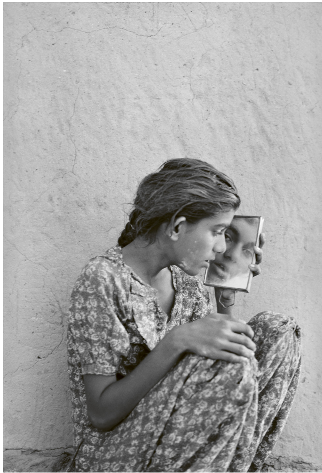
高丽·吉尔 (Gauri Gill) 《沙漠札记》 Jannat, Barmer (1999-)